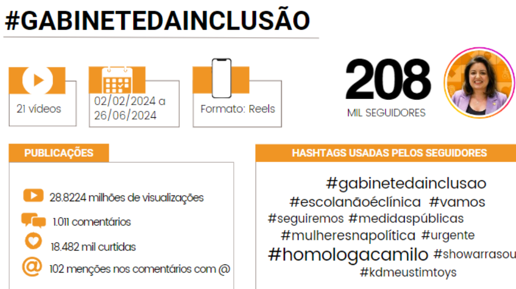
Figura 2 – Infográfico com a análise dos vídeos publicados no ‘Gabinete da Inclusão’, no perfil do Instagram da deputada Andréa Werner

informação para a liberdade de expressão, o uso dos meios de comunicação massivos, o documento ‘Um mundo e muitas vozes’ 3 e o Pacto dos Direitos Humanos de San José 4 .