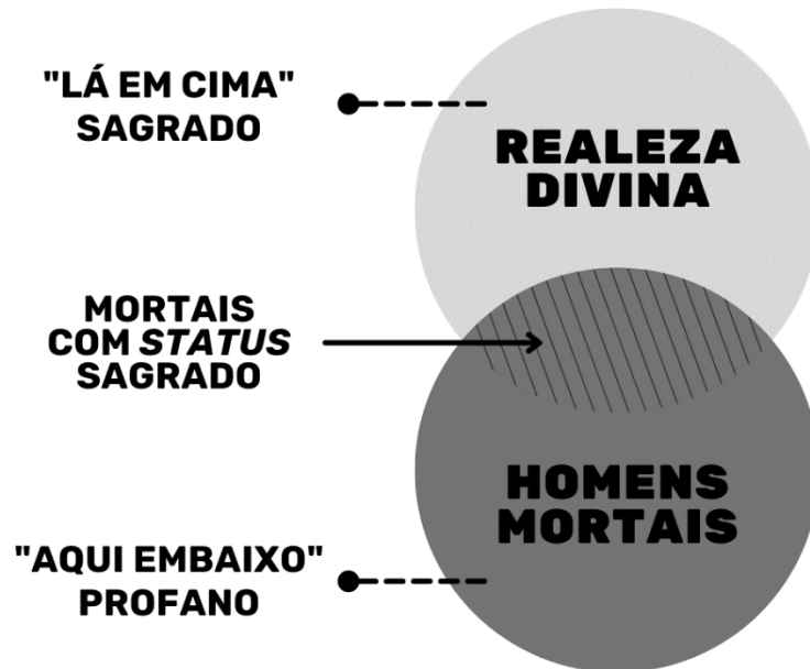
Diagrama 1: Mortais com status sagrado em relação ao referencial duplo de Berger.