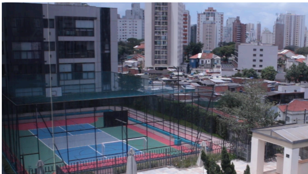
Figura 2 - Foto tirada da academia Ultra na Rua Rio Grande que mostra o condomínio Casas Vila Mariana que divide muro com a comunidade Mário Cardim ao fundo

abordagem sociológica e antropológica. Situa-se com seus arredores repletos de instituições para pessoas de alta renda, alguns exemplos são a própria ESPM, a Faculdade Belas Artes (essas duas a 400m da comunidade), a FAPCOM; à distância de uma quadra possui alguns restaurantes de alto desembolso 5 como o Bar Pirajá, a Taverna Medieval, Jojo Lamen e Bráz Quintal, além da Rua Joaquim Távora a 650m, popularmente conhecido em São Paulo pelo sua densidade de restaurantes e bares; juntam-se também ao redor - e para a pesquisa um dos pontos importantes - diversos prédios residenciais (condomínios) de alto e médio padrão 6 , como o visto na figura 2, o que implica em estes moradores circularem pelas mesmas ruas e estabelecimentos que os da Mário Cardim.