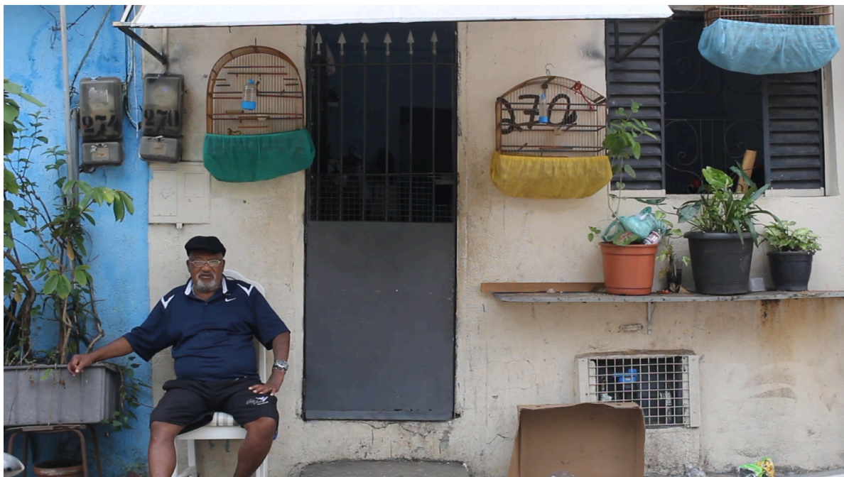
Figura 7 - Foto do Avô na frente de sua casa